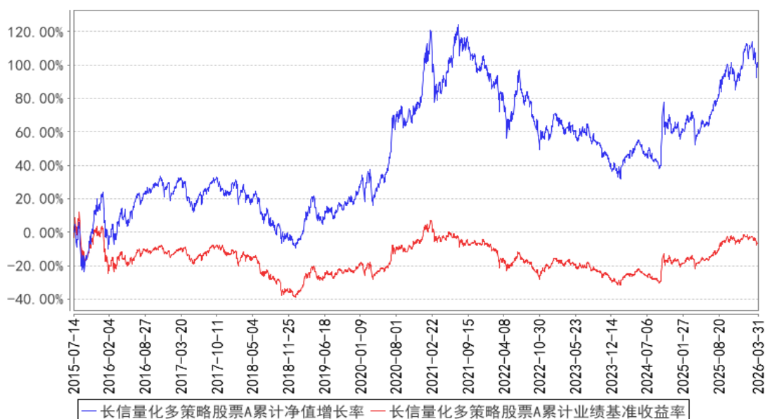
长信量化多策略股票A累计净值增长率与同期业绩比较基准收益率的历史走势对比图