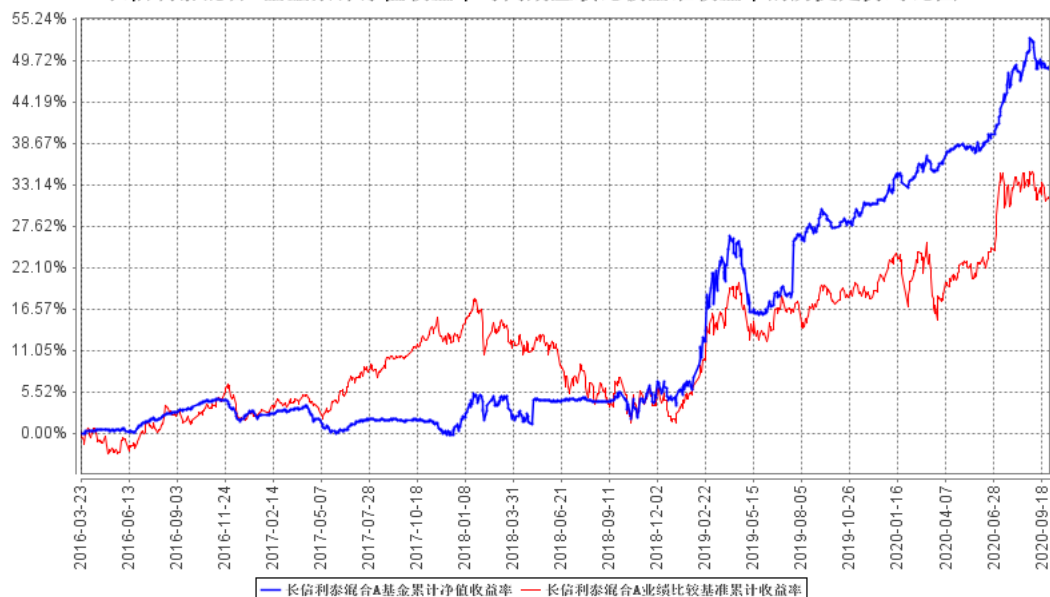
长信利泰混合A基金累计净值收益率与同期业绩比较基准收益率的历史走势对比图

自基金合同生效以来基金份额累计净值增长率变动及其与同期业绩比较基准收益率变动的比较